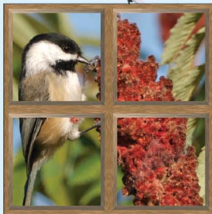
MÉSANGE À TÊTE NOIRE QUI SE NOURRIT DE SUMAC INDIGÈNE.

➤ Déplacez les plantes d'intérieur loin de vos fenêtres ou installez des stores à lattes et les tourner en position ouverte pendant le jour.